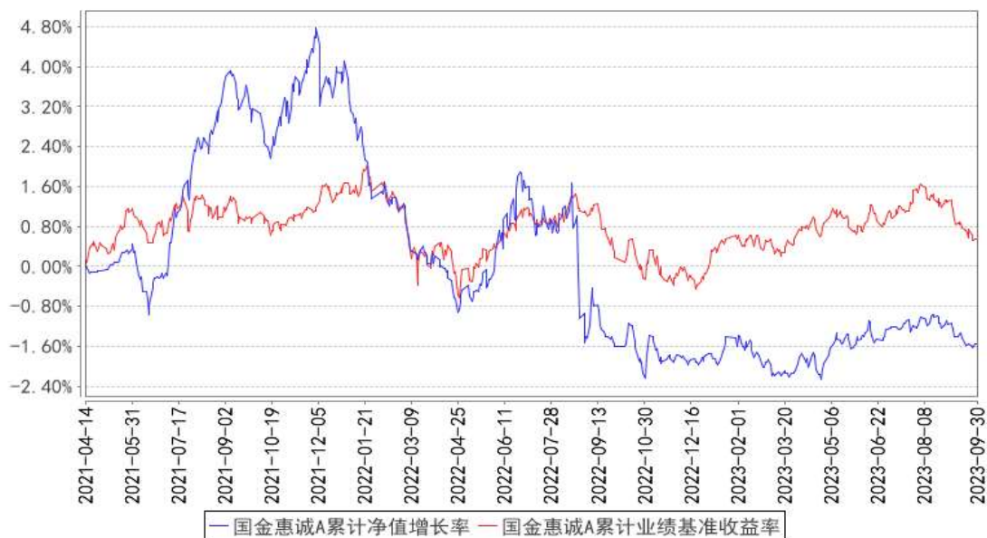
国金惠诚A累计净值增长率与同期业绩比较基准收益率的历史走势对比图