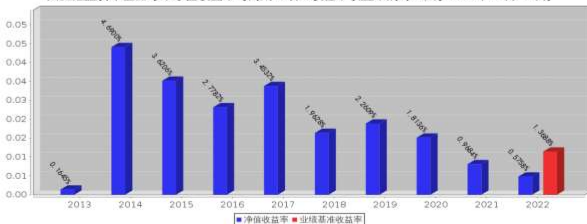
国金鑫盈货币基金每年净值收益率与同期业绩比较基准收益率的对比图(2022年12月31日)

注:业绩表现截止日期 2022 年 12 月 31 日。基金过往业绩不代表未来表现。